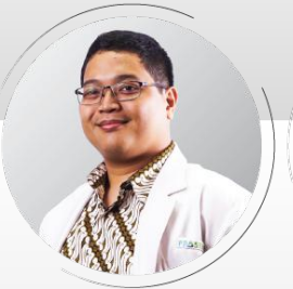
HEALTHCARE H. BIMANTORO