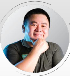
TEKNOLOGI KIWI ALIWARGA