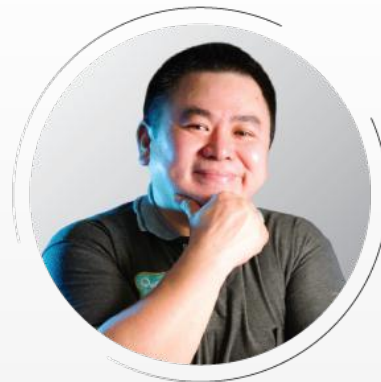
TEKNOLOGI KIWI ALIWARGA